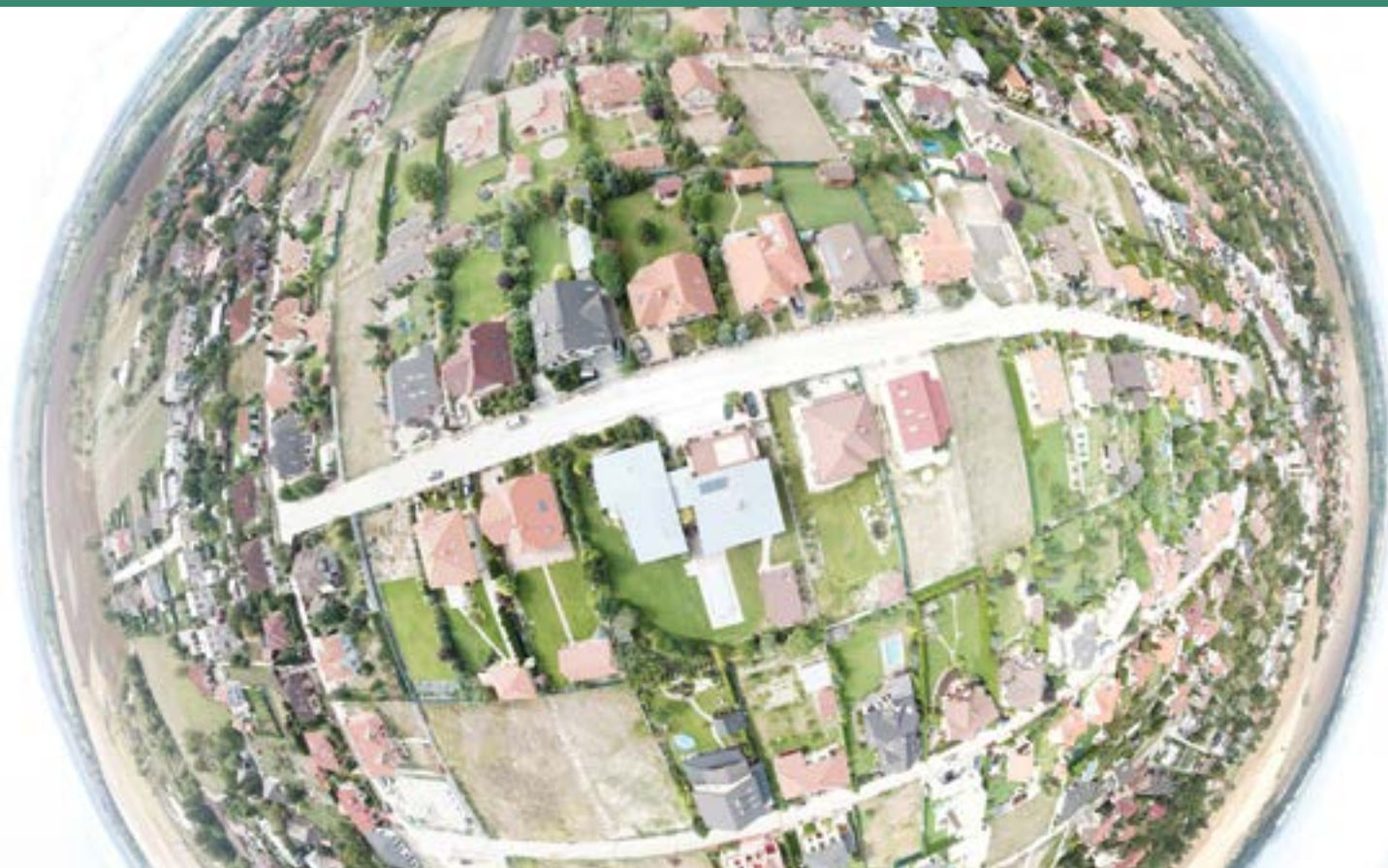
Planéta Zálesie