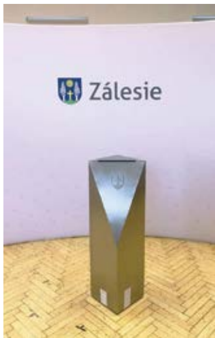
nová volebná schránka a vkusný paraván

výsledkov. V druhom kole voľieb, v sobotu 30.3.2019 bola tiež pekná účasť voličov, 65% (celoslovenská 41,79 %).