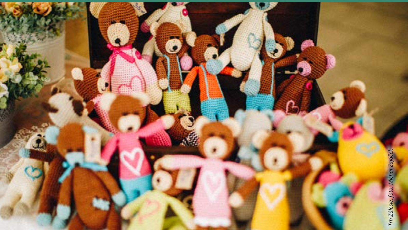
Trh Zálesie