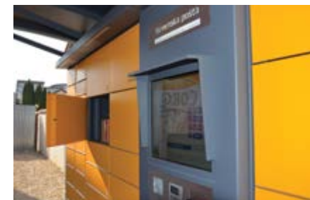
BALÍKOBX Zálesie, Malinovská 54

z e-shopu si vyberiete doručenie do vybraného BALÍKOBXU. Na e-shope ho vo väčšine prípadov nájdete v kolónke „Balík na poštu“. Potom vám už len príde SMS o uložení vášho tovaru v BALÍKOBXE, kde na vás počká aj tri dni. V prípade balíka na dobierku dostanete aj informáciu o sume,