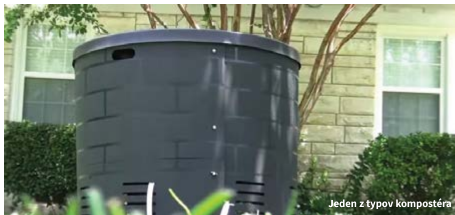
Jeden z typov kompostéra

So začínajúcim jarným obdobím čoraz viac vychádzame nielen do voľnej prírody, ale aj do záhrad. Striháme stromy, pripravujeme záhony na jarnú výsadbu, vyhrabujeme suchú trávu či presádzame kvety. Aj pri vymenovaných aktivitách vzniká odpad – takzvaný biologicky rozložiteľný odpad. Bioodpad nie je žiaden nový terminus technicus. Tvorili sme ho vždy, je súčasťou našich kuchýň, pivníc, špájz aj záhrad. Zmenilo sa len narábanie s ním. Smeroval domácim zvieratám, na „hnoj“, či do kompostovača, ktorý býval kedysi bežnou súčasťou záhrad a znova sa do nich navracia. Alternatívnu