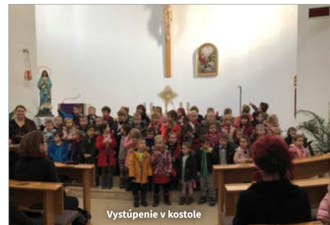
Vystúpenie v kostole

Pred začiatkom zimných prázdnin sme spolu s deťmi oslávili Vianoce pod vianočným stromčekom plným krásnych darčiekov od Ježiška. Obohacujúcou akciou nielen pre rodičov, ale i pre celú obec, bolo kultúrne vystúpenie našich detí v miestnom kostole. Predviedli sa s rôznymi koledami, piesňami i básňami.