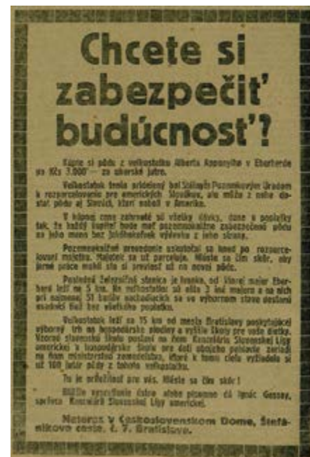
Inzerát uvedený v novinách Slovenský denník dňa 11. februára 1923