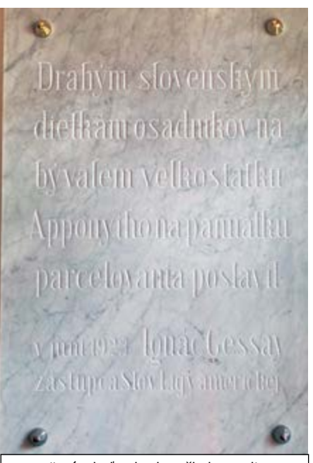
Pamätná tabuľa v budove školy v Malinove